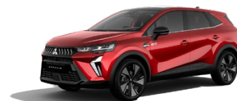
Prémiová metalická červená Sunrise Red