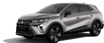
Metalická sivá Steel Grey