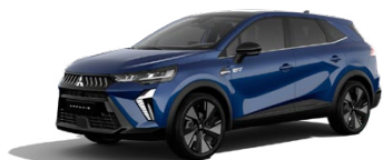
Metalická modrá Royal Blue