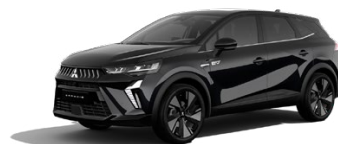
Metalická čierna Onyx Black