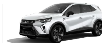
Prémiová metalická biela Crystal White