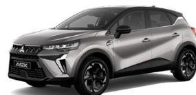
Metalická sivá Steel Grey / čierna strecha