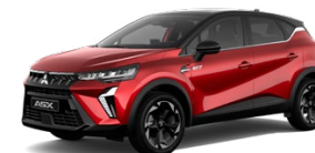
Prémiová metalická červená Sunrise Red / čierna strecha