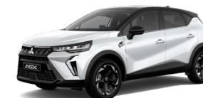
Prémiová metalická biela Crystal White / čierna strecha