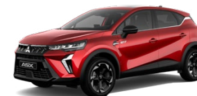
Prémiová metalická červená Sunrise Red