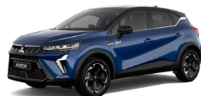
Metalická modrá Royal Blue / čierna strecha