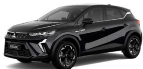
Metalická čierna Onyx Black