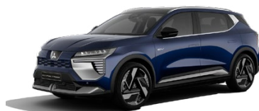
Prémiová metalická modrá Sapphire Blue 1100 EUR