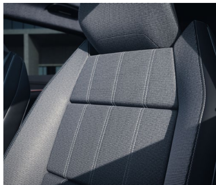
INTENSE+ Kombinácia sivá látka / čierna syntetická koža