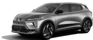
Metalická sivá Volcanic Grey 740 EUR