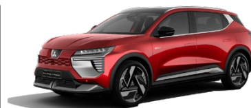
Prémiová metalická červená Sunrise Red ■