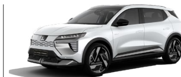
Prémiová metalická biela Crystal White 1100 EUR