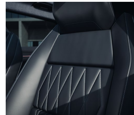
INSTYLE Čierna syntetická koža