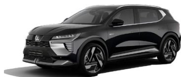
Metalická čierna Onyx Black 740 EUR