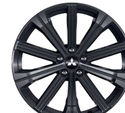
20" Disk z ľahkých zliatin Čierny