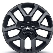
18" Disk z ľahkých zliatin Čierny