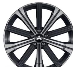
20" Disk z ľahkých zliatin Čierno-strieborný