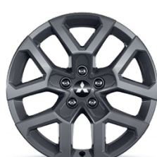
18" Disk z ľahkých zliatin Sivý