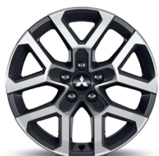
18" Disk z ľahkých zliatin Čierno-strieborný